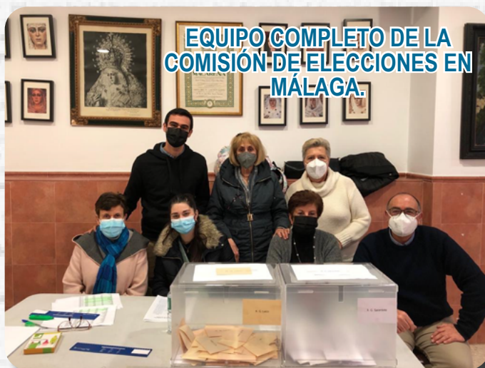
EQUIPO COMPLETO DE LA COMISIÓN DE ELECCIONES EN MÁLAGA.