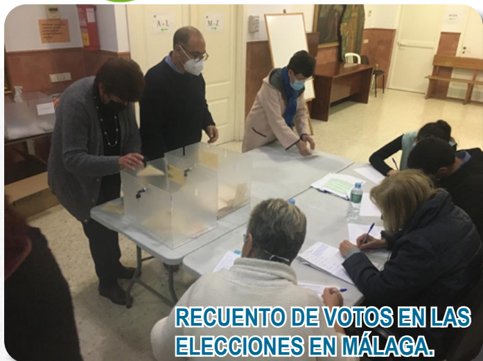
RECuento DE VOTOS EN LAS ELECCIONES EN MÁLAGA.